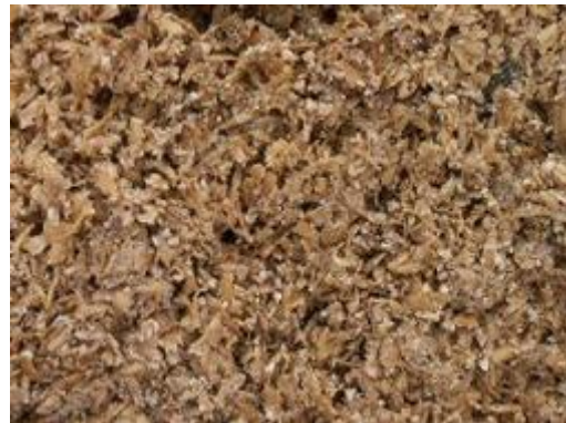
Відходи пивної промисловості